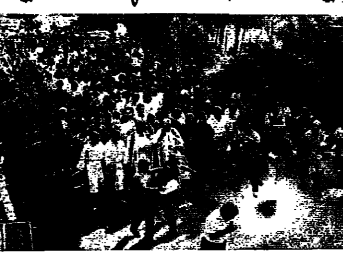
المسيرة في الدور

في ختام الشهر المريي، نظمت مسيرات بالمشاعل من اجل السلام في لبنان.